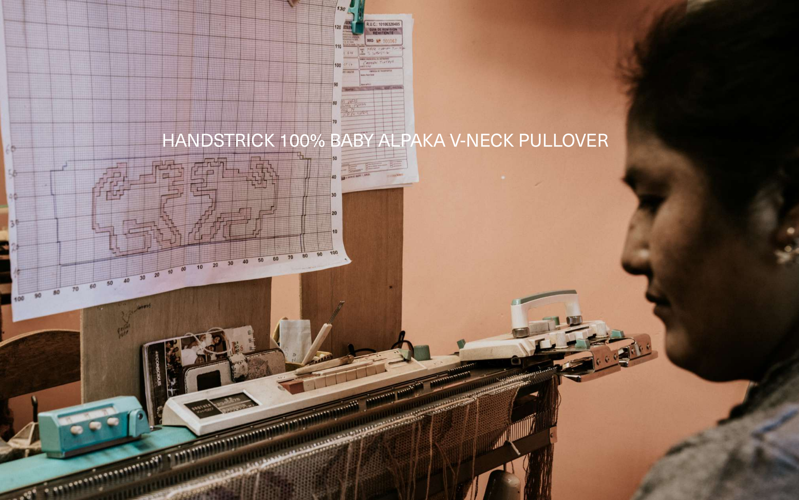
HANDSTRICK 100% BABY ALPAKA V-NECK PULLOVER