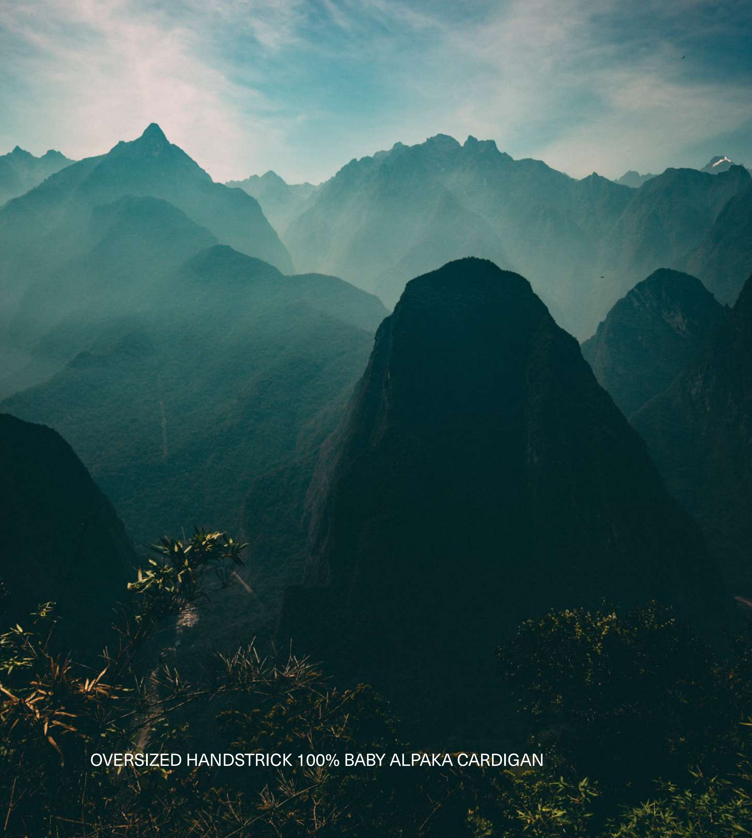
OVERSIZED HANDSTRICK 100% BABY ALPAKA CARDIGAN